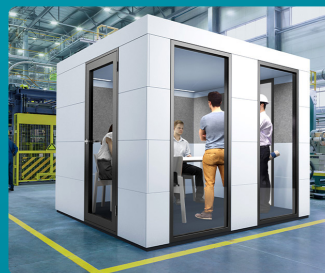
Besprechung im Lager