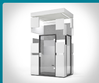
flexibel durch einfache Umpositionierung