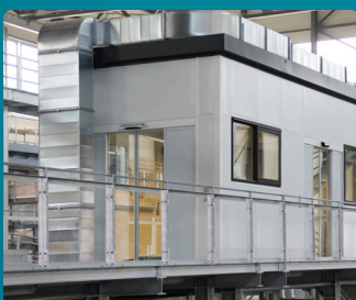
für Innen- und Außenbereich